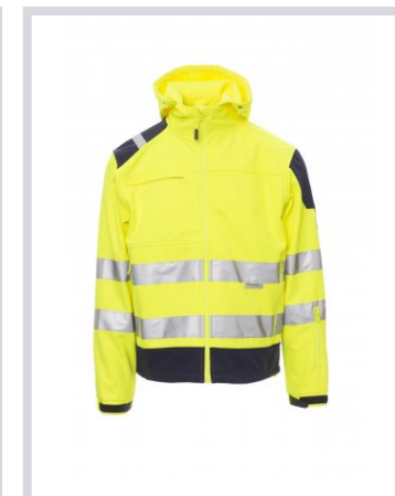
ŽUTA FLUO/MORNARSKO PLAVA