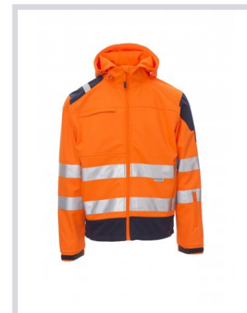
NARANČASTA FLUO/MORNARSKO PLAVA