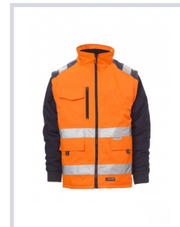
NARANČASTA FLUO/MORNARSKO PLAVA