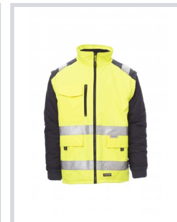
ŽUTA FLUO/MORNARSKO PLAVA