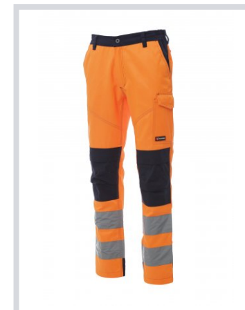
NARANČASTA FLUO/MORNARSKO PLAVA