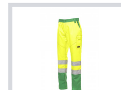
ŽUTA FLUO/ZELENA Upute za pranje