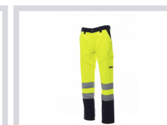
ŽUTA FLUO/MORNARSKO PLAGA