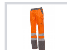
NARANČASTA FLUO/BOJA SIVOG ČELIKA