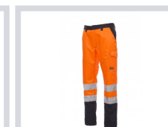
NARANČASTA FLUO/MORNARSKO PLAGA