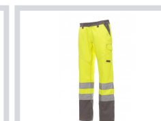
ŽUTA FLUO/BOJA SIVOG ČELIKA