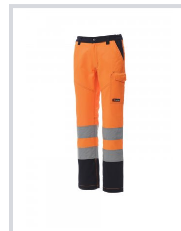
NARANČASTA FLUO/MORNARSKO PLAVA