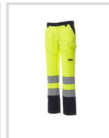
ŽUTA FLUO/MORNARSKO PLAVA